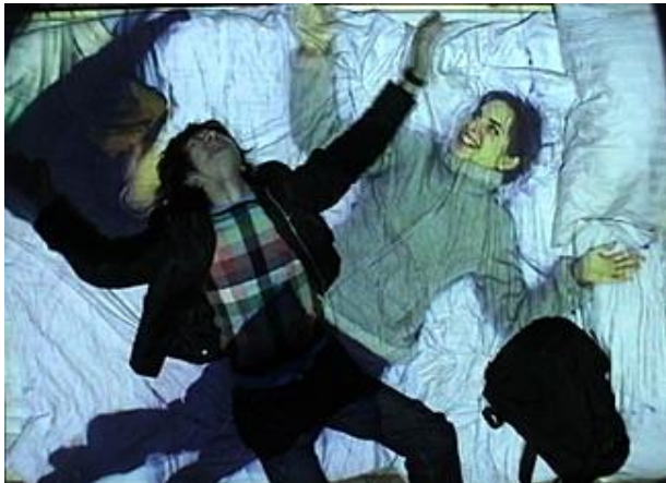
تصویر ۶- پُل سِرْمُن، ۱۹۹۲. رؤیای تله‌ماتیک .

یکی از برجسته‌ترین نمونه‌هایی که این کیفیت هنر تله‌ماتیک را بازتاب می‌دهد، رؤیای تله -ماتیک ۱۱۲ (۱۹۹۲) اثر پُل سِرْمُن ۱۱۳ است. آن‌طور که هنرمند، در تارنمای رسمی خود، در توضیح این اثر می‌گوید؛ این اثر اینستالیشنی تله‌ماتیک است، که از شبکه‌ی تلفن دیجیتال آی‌اس دی‌ان ۱۱۴ به عنوان خط