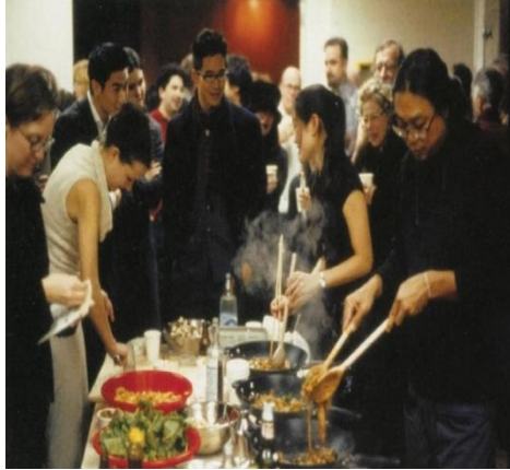
تصویر ۳- ریپرکری تیراوانیجا، ۱۹۹۲. بدون عنوان/دستگاه تقطیر.

ریپرکری تیراوانیجا ۸۶ ، در سال ۱۹۹۲ در گالری ۳۰۳ نیویورک، اثر بدون عنوان ۸۷ را به نمایش گذاشت،