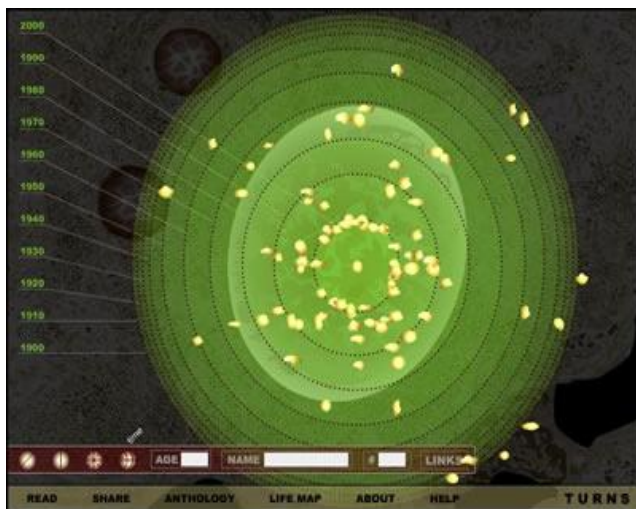
تصویر ۷- مارگت لاجی، ۲۰۰۱. نقاطِ عطف.

نقاطِ عطف ۱۲۵ (۲۰۰۱) از مارگت لاجی ۱۲۶ ، یکی از چندین و چند پروژه‌ی اینترنتی‌ایی است که می‌تواند در توضیح منظور ما راه‌گشا باشد: این اثر که در سال ۲۰۰۲ در دوسالانه‌ی ویتنی ۱۲۷ به نمایش درآمد، متشکل از تارنمایی بود که به مخاطبان وصل-خط ۱۲۸ امکان می‌داد تا با اتصال به آن تارنما، به عنوان یک پروژه‌ی مشارکتی (در معنای عام کلمه)، با اثر "تعامل" کنند. سازوکار فنی اثر به این صورت بود که هر