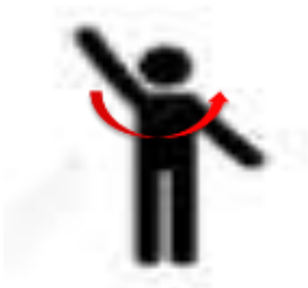
شکل ۱: وضعیت دست‌ها موقع چرخش

داوطلب ایستاده دست‌ها را کشیده از پهلو بالا می‌آورد به گونه‌ای که بازوها با تنه زاویه‌ی ۹۰ درجه درست می‌کردند. آنگاه با شروع به چرخش به سمت چپ، دست راست اندکی به طرف بالا برده می‌شد به گونه‌ای که زاویه‌ی بین بازو و تنه به حدود ۱۲۵ می‌رسید و کف دست رو به آسمان قرار می‌گرفت همزمان دست چپ اندکی به طرف پایین آورده می‌شد. به گونه‌ای که زاویه‌ی بازو با تنه به حدود ۶۰ درجه می‌رسید و کف دست رو به پایین قرار می‌گرفت. با ایجاد وقفه‌ی ۵ ثانیه‌ای و تغییر جهت چرخش، دست چپ بالا و دست راست پایین، آن گونه که در چرخش به چپ، قرار می‌گرفت. شکل ترسیمی شماره ۱ وضعیت قرارگیری دست‌ها را نشان می‌دهد.